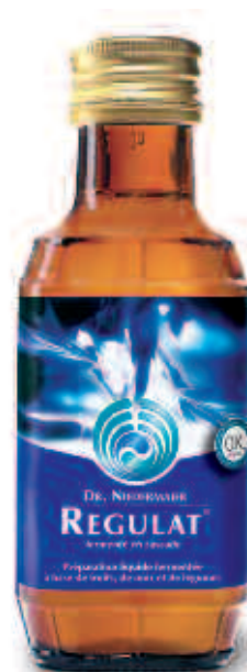
Regulat® bouteille de 100 ml Réf. 1311012

Parfait pour une cure de 5 jours ou pour un usage externe prolongé.