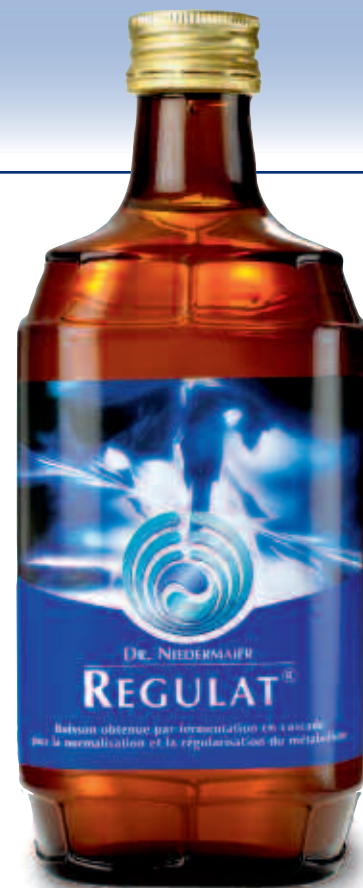
Regulat® bouteille de 350 ml Réf. 1313511

Parfait pour une cure de 5 jours ou pour un usage externe prolongé.